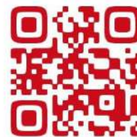
基幹センターQRコードです

じゆうしよふくおかけんいづかしただくま いづかしやくしよほなみししよかい 住 所：福岡県飯塚市忠隈523（飯塚市役所穂波支所4階） 電 話：0948-43-4006 ファックス：0948-43-4021 メールアドレス：soudan@iikk-kikan.jp ホームページ：http://iikk-kikan.jp