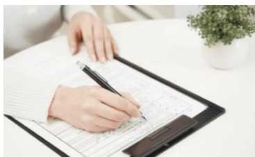
臨床心理士・理学療法士（常駐）