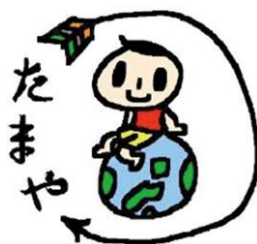
発達障がい支援研究所