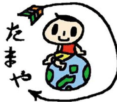
発達障がい支援研究所