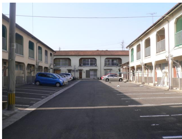
第二・第三清浄ホーム