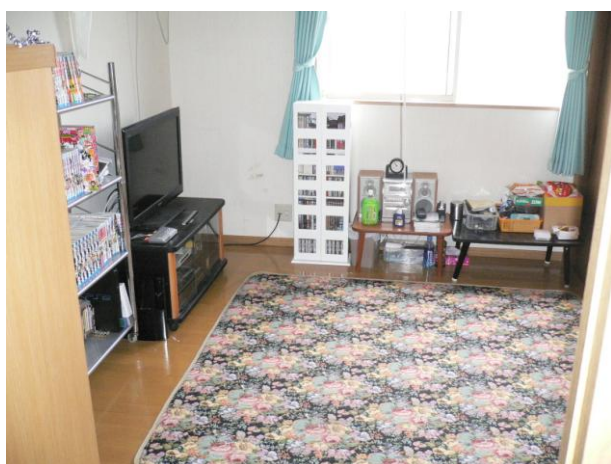
第一清浄ホーム居室