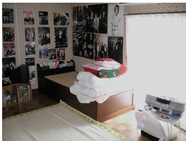
第二・第三清浄ホーム居室