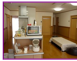
とうきびの家（リビング）