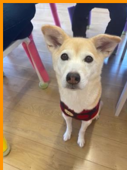
アイドル犬「グッド」ちゃん