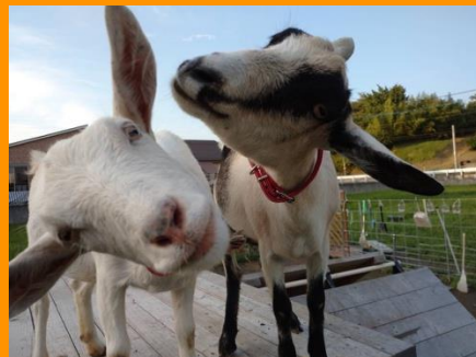
アイドルヤギ「みるく&もか」ちゃん。