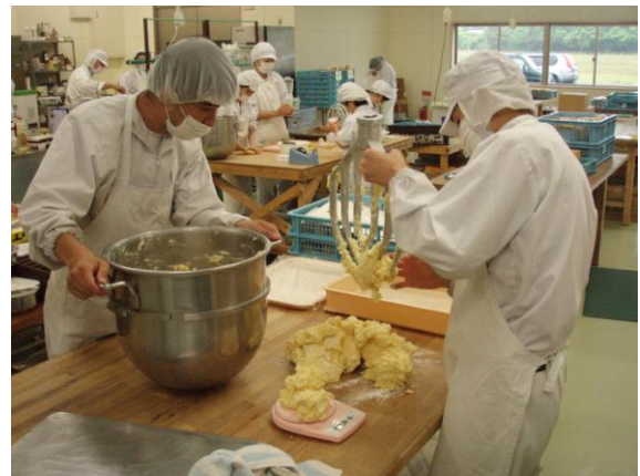
パン・クッキー等の製造風景