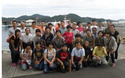
毎年恒例の忘年会旅行です。