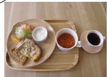
彩りや食器にまで こだわった昼食