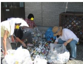
リサイクル品分別