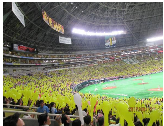
毎年野球観戦に行ってます。