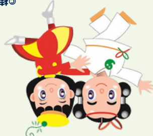
未来ちゃん ◎桂川町

総合的な相談の窓口として、生活の悩みや、ご家族や関係者の方の心配事などお受けします。