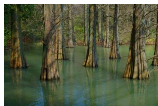
体力測定(九大の森)