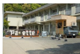
バドミントン大会