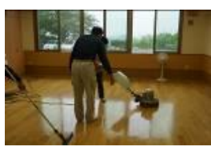
清掃トレーニング