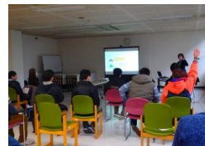
ナカポツセミナー